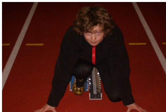
startblokkentraining 21 maart